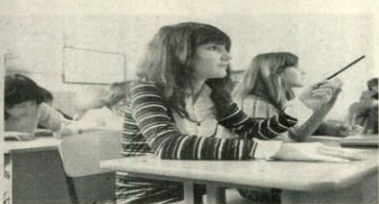
Para aquellos docentes que desean incorporar más elementos audiovisuales a la hora de enseñar a niños pequeños, existe un Moodle desarrollado por expertos del British Film Institute e impartido a través de la plataforma Future Learn, que tiene como objetivo analizar el cine como herramienta para alfabetizar a las personas, así como estrategias para poner en práctica esta técnica en el aula.