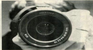
La Academia Superior de Artes, ubicada en Medellín, Antioquia, ofrece un curso de 120 horas de duración en Fotografía de producto. El programa aborda los conceptos básicos de la fotografía, el funcionamiento de la cámara digital, teoría del color, edición y retoque de las imágenes en programas como Photoshop, en diversas sesiones prácticas y teóricas.