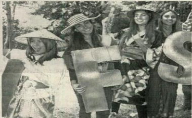
Ser voluntario es una experiencia que además de transformar la vida de quienes deciden hacerlo conlleva diferentes beneficios a nivel académico, competitivo, laboral e intercultural. Para los expertos, vivir y realizar actividades como esta en otro entorno ayuda a desarrollar la creatividad, enriquece los conocimientos generales, fortalece el manejo de un segundo idioma, mejora las capacidades de comunicación y amplía la visión del mundo.