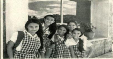
Prodios de 63 Entidades Territoriales Certificadas superaron la fase de verificación de condiciones técnicas y jurídicas que realizó el Ministerio de Educación y ya se encuentran listos para priorizar proyectos del Plan Nacional de Infraestructura Educativa, con el fin de implementar la jornada única.