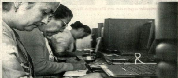
Con este programa se busca promover el desarrollo de la población rural a través de diferentes procesos de formación. De este modo se pretende mejorar la inclusión social.

Escuelas Digitales Campesinas es un programa de Acción Cultural Popular que promueve el desarrollo del medio rural colombiano a través de procesos de educación, formación y capacitación, orientados a mejorar la condición de los campesinos, su inclusión social, cultural, económica y digital. ACPO dispone de ocho Escuelas Digitales Campesinas en Antioquia, con más de 800 beneficiarios en total, 7 EDC en Boyacá, donde cuenta con 1.500 beneficiarios, 4 en Cauca, con 600 beneficiarios en total, 4 en Cauca, con 5.000 beneficiarios totales, 3 en Chocó, con más de 1.000 beneficiarios totales, siete en Cundinamarca, con más de 1.500 beneficiarios totales, seis en La Guajira, con más de